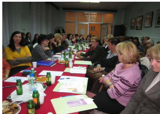
Okrugli stol u Ogulinu

Treći Okrugli stol održan je 3.11.2009. u Kulturno-informativnom centru Zagreb i na njemu je sudjelovalo 80 predstavnika osnovnih i srednjih škola, centara za socijalnu skrb, patronažne službe, školske medicine, primarne ginekološke zaštite, nevladinih udruga, predstavnici Ministarstva obitelji, branitelja i međugeneracijske solidarnosti, Gradskog ureda za socijalnu zaštitu i osobe s invaliditetom te Gradskog ureda za obrazovanje, kulturu i šport Grada Zagreba.