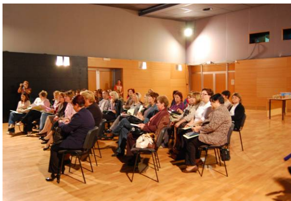
Okrugli stol u Koprivnici

Drugi Okrugli stol održan je u suradnji s Udrugom roditelja djece i mladeži Ogulin, 05.10.2009. u Gradskoj vijećnici u Ogulinu, na kojem je sudjelovalo 50 osoba.