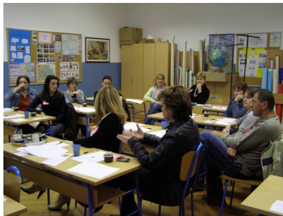
OŠ Dr.Franje Tuđmana, Lički Osik

U svakoj od škola održano je predavanje za učiteljsko vijeće na temu razvijanja partnerstva roditelja i škole. Učiteljska vijeća upoznata su s preporukama o razvijanju partnerstva te pozvana na sudjelovanje na radionicama za roditelje.