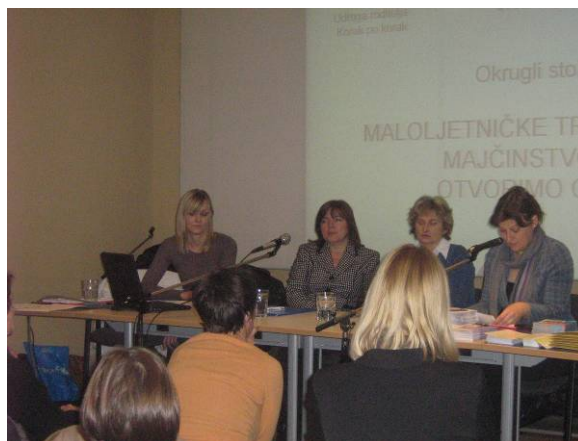
Okrugli stol u Zagrebu

Treći Okrugli stol održan je 3.11.2009. u Kulturno-informativnom centru Zagreb i na njemu je sudjelovalo 80 predstavnika osnovnih i srednjih škola, centara za socijalnu skrb, patronažne službe, školske medicine, primarne ginekološke zaštite, nevladinih udruga, predstavnici Ministarstva obitelji, branitelja i međugeneracijske solidarnosti, Gradskog ureda za socijalnu zaštitu i osobe s invaliditetom te Gradskog ureda za obrazovanje, kulturu i šport Grada Zagreba.