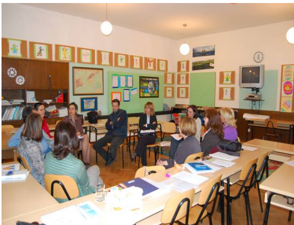
OŠ K.Š.Gjalskog, Zagreb

OŠ Ljudevita Gaja, Zaprešić OŠ K. Š. Gjalskog, Zabok OŠ Marija Bistrica OŠ Frana Galovića, Zagreb OŠ Dobriše Cesarića, Zagreb OŠ Kuršanec OŠ Eugena Kumičića, Velika Gorica OŠ Martijanec, Varaždin OŠ Dr. Jure Turića, Gospić OŠ Dr. Franje Tuđmana, Lički Osik