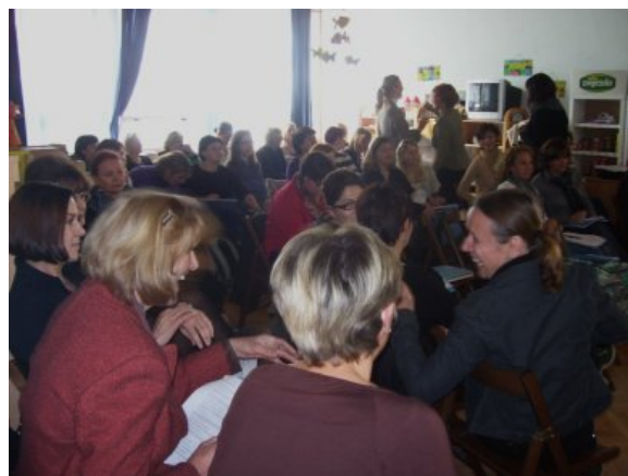
Predškolski CAP seminar, Kaštel Lukšić