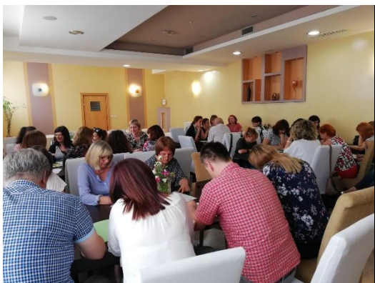
Seminar Osijek, Hotel Silver, 5/2018

Tijekom 2018. održana su 2 seminara nazivom MALOLJETNIČKE TRUDNOĆE I RODITELJSTVO - izazovi u radu i mogućnosti i to u svibnju u Osijeku na kojem je sudjelovalo 43 sudionika te u listopadu u Vodiciama na kojem je sudjelovalo 40 sudionika. Seminari su okupili stručnjake iz područja zaštite prava djece i obitelji iz brojnih centara za socijalnu skrb, zdravstvenih ustanova, dječjih domova, organizacija civilnoga društva koji se u svojem radu susreću s maloljetničkim trudnoćama i roditeljstvom.