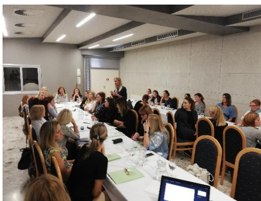
Seminar Vodice, Hotel Imperial, 10/2018